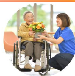
在宅看護や介護施設 などへの入居者様