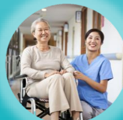
入院中や リハビリ中の患者様