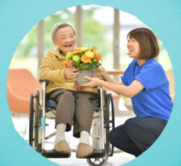
在宅看護や介護施設 などへの入居者様