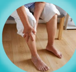
足のむくみがつらい方 弾性ストッキングを履きづらい方

まだまだ「足を使う機会が多い方の足の浮腫み」に 対応できるストッキングとして設計しました